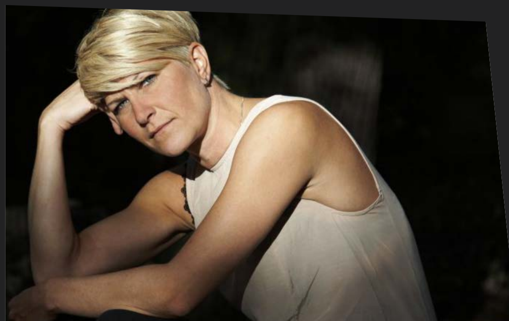
VERA (DJ SET) - 19 SETTEMBRE DALLE 20:00 - VIA LANZI