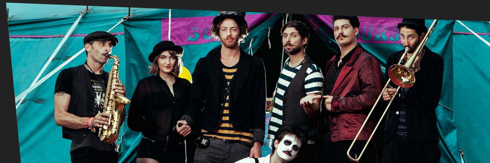
THE SWEET LIFE SOCIETY 19 SETTEMBRE DALLE 23:00 - PIAZZA SAN FRANCESCO