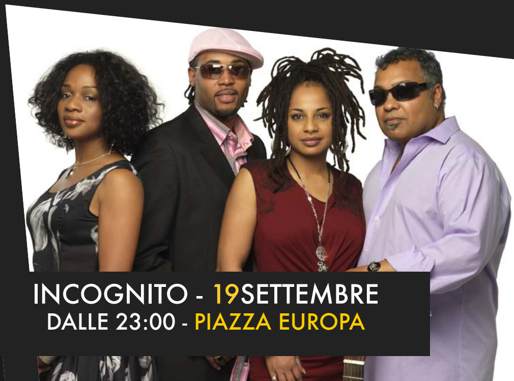
INCOGNITO - 19 SETTEMBRE DALLE 23:00 - PIAZZA EUROPA