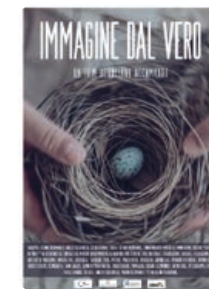
IMMAGINE DAL VERO

di Luciano Accomando Italia, 2017; durata 66'