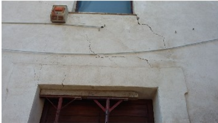
Lesioni ala nord est – particolare architrave