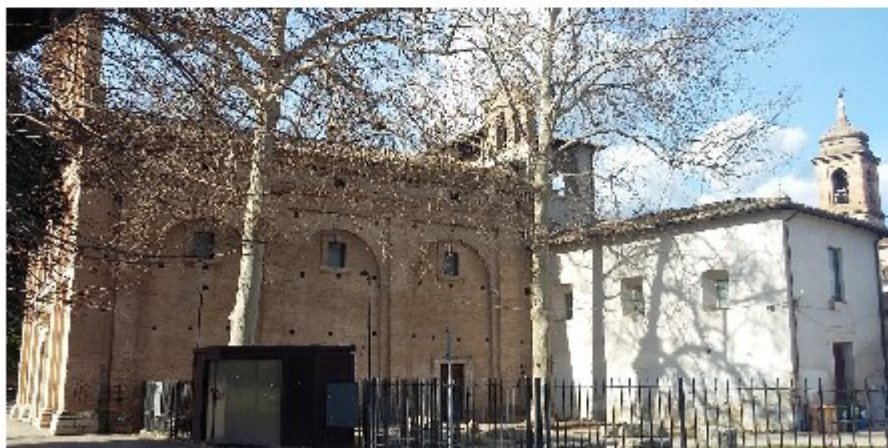
Foto ex Chiesa Santa Maria del Carmine – Prospetto est con sagrestia