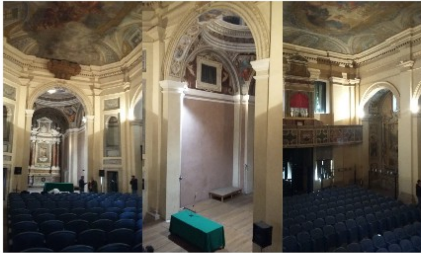
Viste interne del corpo principale

Il controsoffitto della navata centrale è costituito da un velario dipinto suddiviso longitudinalmente in tre parti agganciate ciascuna ad un telaio/cornice realizzato in profili di alluminio. I tre telai in alluminio sono a loro volta collegati tra loro e con i muri perimetrali (dove poggiano su delle mensole stuccate e decorate che descrivono tutto il perimetro della navata della chiesa) tramite speciali morsetti. I due telai laterali sono appesi a guide metalliche le quali sembra possano ancora oggi permettere lo scorrimento verso il centro del telaio/cornice. Il telaio centrale invece è collegato ad una complessa struttura a graticcio in metallo che a sua volta è appesa tramite ganci e corde in acciaio a n. 6 argani a motore elettrico che, comandati tramite un quadro elettrico di comando, ne dovrebbe azionare una serie di movimenti obbligati necessari per il calo a terra della tela e della cornice (vedere foto seguenti).