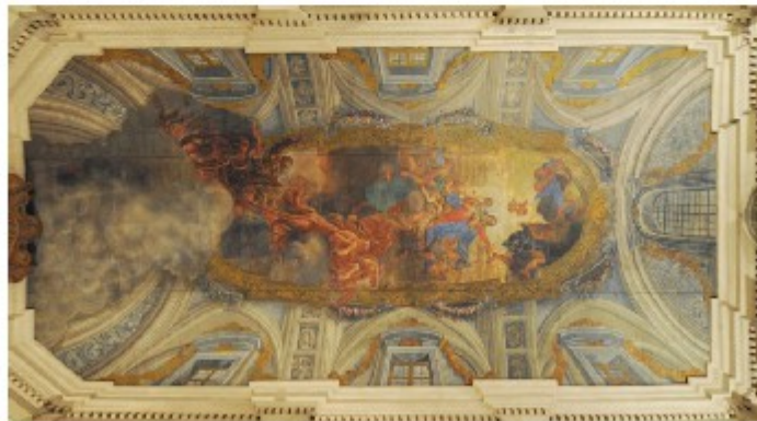
Velario a copertura della navata centrale

Il controsoffitto della navata centrale è costituito da un velario dipinto suddiviso longitudinalmente in tre parti agganciate ciascuna ad un telaio/cornice realizzato in profili di alluminio. I tre telai in alluminio sono a loro volta collegati tra loro e con i muri perimetrali (dove poggiano su delle mensole stuccate e decorate che descrivono tutto il perimetro della navata della chiesa) tramite speciali morsetti. I due telai laterali sono appesi a guide metalliche le quali sembra possano ancora oggi permettere lo scorrimento verso il centro del telaio/cornice. Il telaio centrale invece è collegato ad una complessa struttura a graticcio in metallo che a sua volta è appesa tramite ganci e corde in acciaio a n. 6 argani a motore elettrico che, comandati tramite un quadro elettrico di comando, ne dovrebbe azionare una serie di movimenti obbligati necessari per il calo a terra della tela e della cornice (vedere foto seguenti).