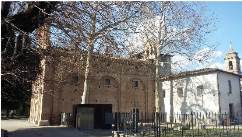
Fronte est del complesso

Dell'intero edificio è disponibile un rilievo geometrico realizzato con tecnologia laser scanner e digitalizzato. Verranno messi a disposizione gli elaborati grafici in formato dwg (piante, prospetti e sezioni) e la nuvola di punti 3D georiferita in formato .las, .ply e .rcp, all'affidatario del servizio.