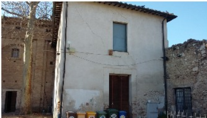
Lesioni ala nord est – vista di insieme