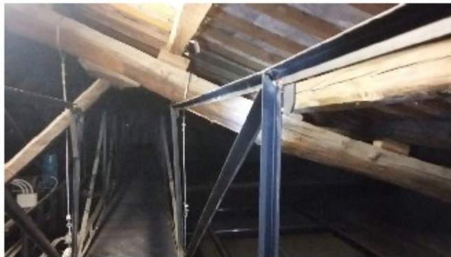
Danneggiamento puntoni capriate 1 e 2