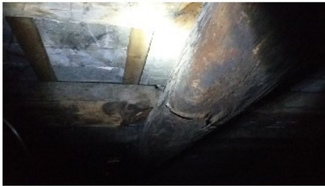
Danneggiamento puntone capriata 3