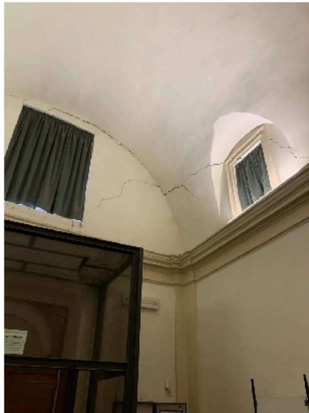
Lesioni ala nord est – particolare dall'interno