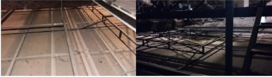
Il sistema di telai a sostegno del velario