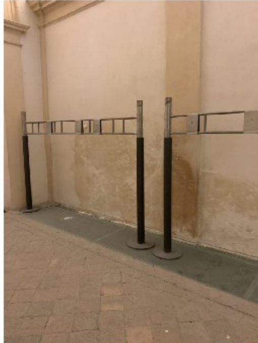
Risalite di umidità