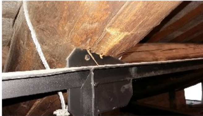
Particolare puntone capriata 2