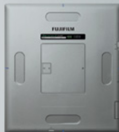
FDR D-EVO II G35 (14 x 17-inch model)