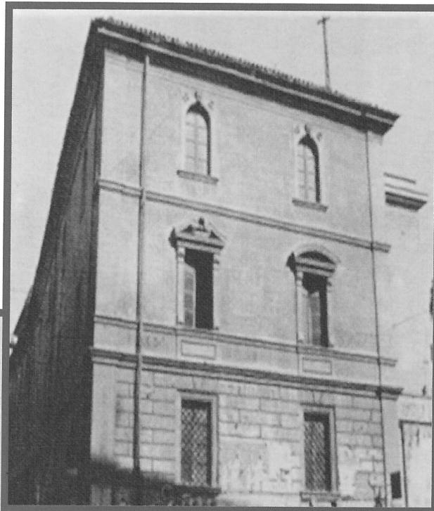
Complesso di Santa Lucia (1889-1911)