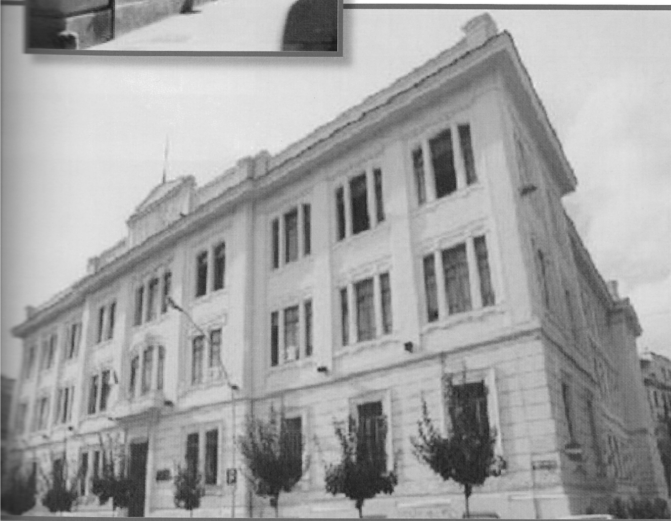
Istituto Tecnico (1933-1935)