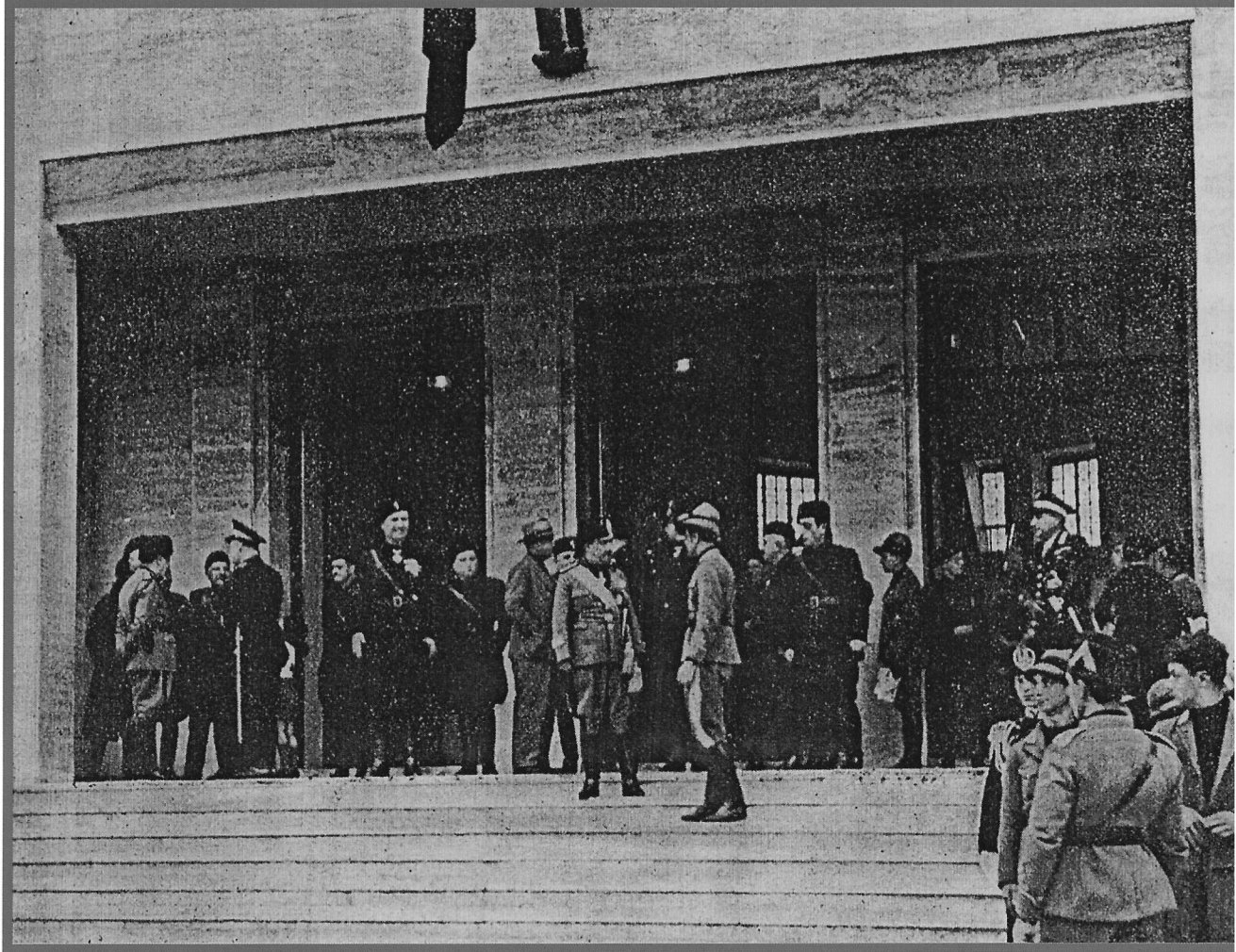
Ministro CESARE MARIA DE VECCHI Governo Mussolini