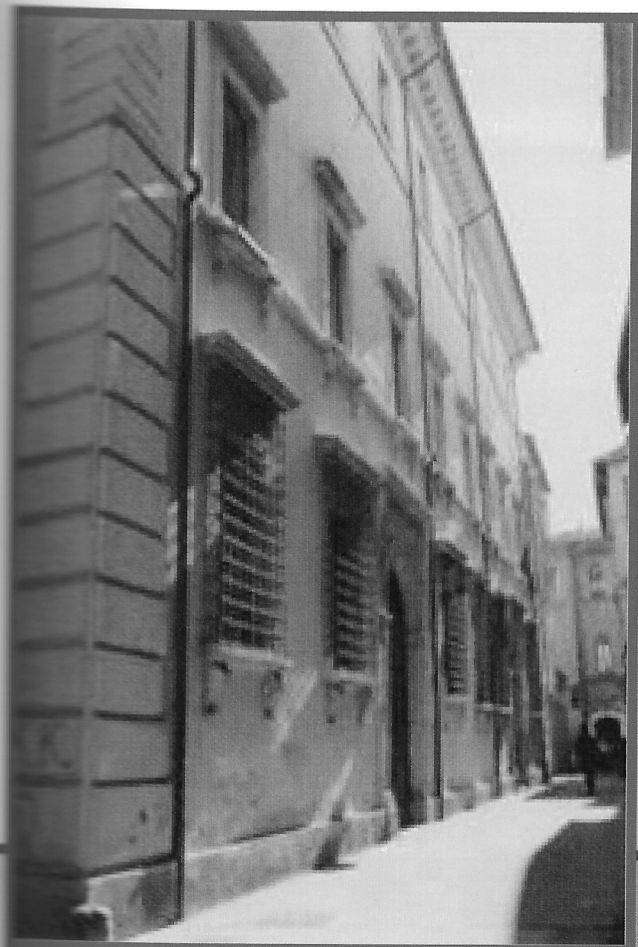
Palazzo Mariani (1912-1932)