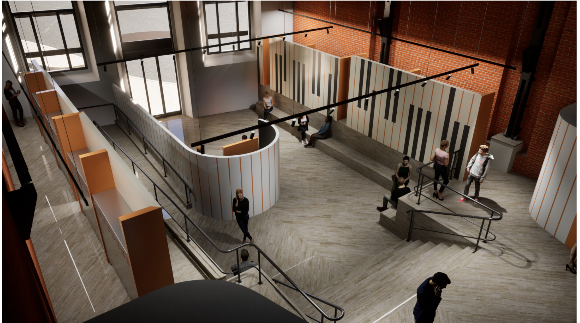
SISTEMAZIONE FUNZIONALE DEL CENTRO MULTIMEDIALE DI TERNI DA ADIBIRE A NUOVA SEDE DEL CONSERVATORIO "G. BRICCIALDI"